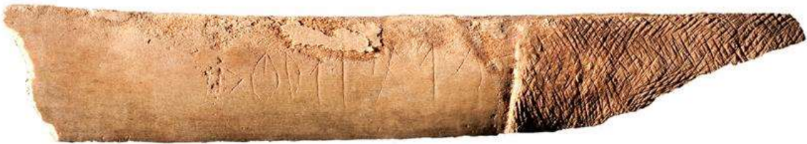
Benplatta med turkisk runskrift (Ungern)